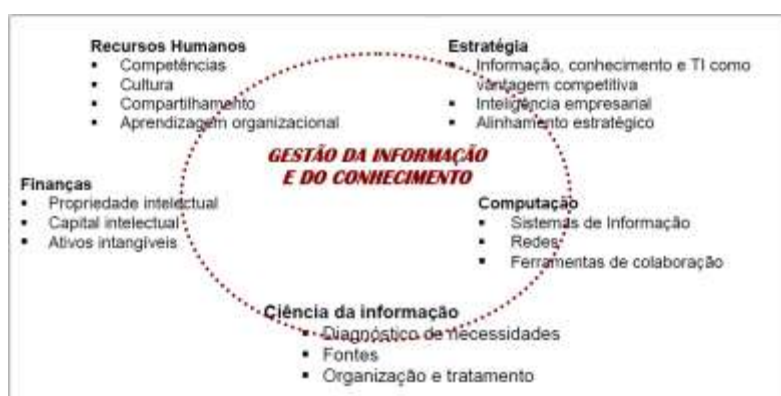
Figura 2 – Uma perspectiva integradora da gestão da informação e do conhecimento

A integração da GI com a GC é proposta por diversos autores, entre eles Barbosa (2008). A Figura 2 ilustra a visão de integração proposta pelo autor: