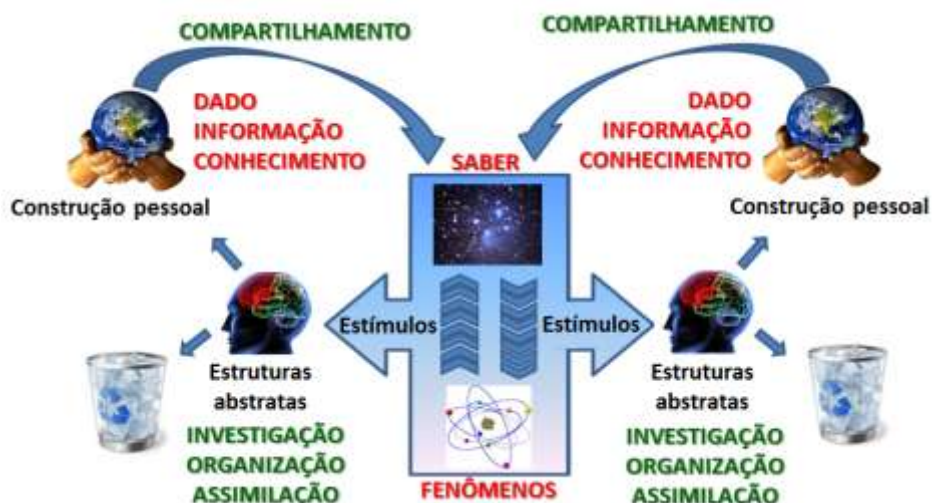
Figura 6 - Visão informacional do mundo

Apenas fechando o conteúdo explorado até o momento, a Figura 6 integra as duas figuras anteriores (Figuras 4 e 5), associando a ideias até então discutidas sobre a abordagem informacional do mundo.