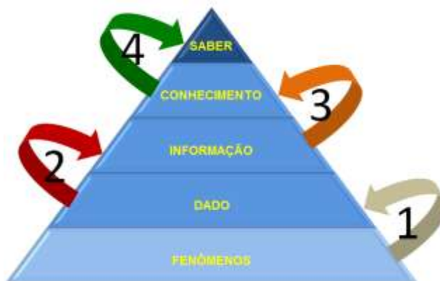
Figura 5 - A Pirâmide de Foskett

para o desenvolvimento deste trabalho. A FIG. 5 representa os principais componentes propostos pelo autor. Conforme detalhamento adiante, os fenômenos ocorrem na natureza, enquanto dado, informação e conhecimento são conceitos usados em um nível individual, e o saber é coletivo – produzido socialmente.