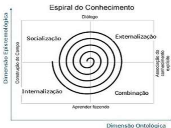
Figura 1 - A espiral do conhecimento Fonte: Nonaka e Takeuchi (1997, p. 80)

Nonaka e Takeuchi (1997) desenvolveram a espiral do conhecimento, mostrada na figura a seguir, a partir dos estudos de Polanyi (1983):